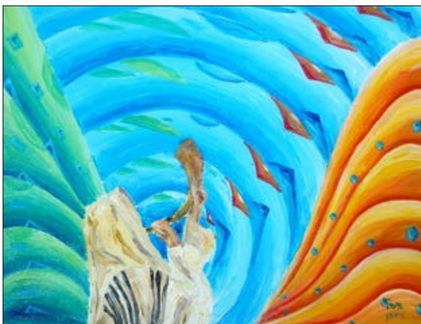
"פתח לנו שער". לנצל את היום הקדוש (ציור: יהושע ויסמן)

אחת העצות הניתנות למצב זה היא לכוון את ההתעוררות של הימים הנוראים להחלטות מעשיות מוגדרות, גם אם הן קטנות. הנטייה הטבעית של אדם בעומדו בהתעוררות ביום