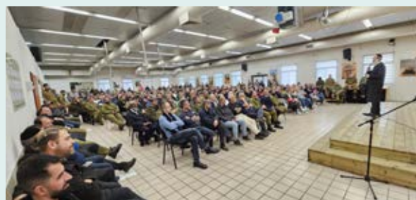
"יש בחיילים משהו שאין בשום קהל אחר". בהרצאה לחיילים

אחר. הם צעירים, נאלצים להתמודד עם מצבי לחץ, סכנה, מאמץ. מאבדים חברים, נפצעים בעצמם, חווים דברים קשים. דווקא הם זקוקים יותר מכול לאמונה, לתקווה, לחיבור תמידי עם הבורא. אני רואה עד כמה הם בולעים בצמא כל מילה שנותנת חיזוק.