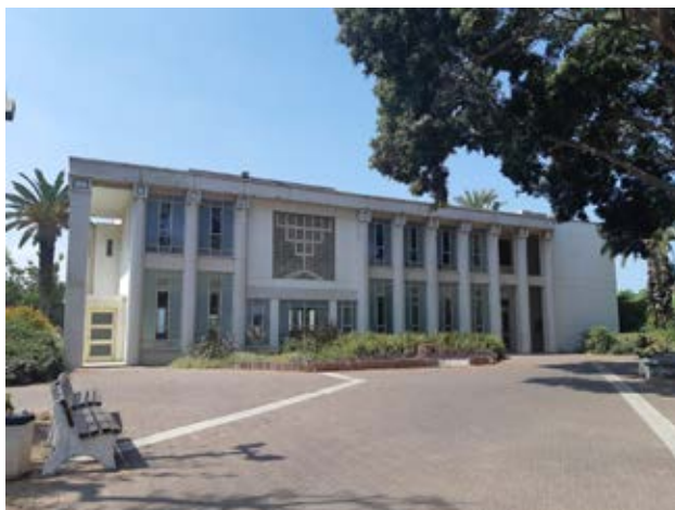
היהודי המוזר. "מכונס בעצמו, רק שפתי נעות" בתמונה: בית הכנסת בקיבוץ יבנה

למושב נווה מבטח הגעתי שפוף ויגע, לאחר שהחושך כבר ירד. נערים שפגשתי בכניסה למושב הסתכלו עליי כעל חייזר. כל גופי ייחל